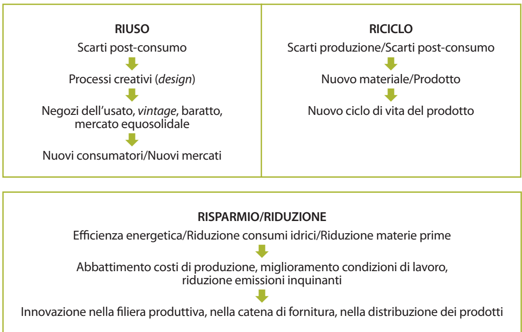
Figura 3 Le tre "R" nella moda

Molto spesso le tre "R" si ritrovano, tutte insieme oppure in combinazioni diverse, in quella strategia di differenziazione dei modelli di mercato e di business basata sulla sostenibilità che va sotto il nome di " fairtrade ", il mercato equo - solidale, che si caratterizza per una forte connotazione sociale e solidaristica e che negli ultimi tempi è diventato per alcune imprese di moda un interessante marketplace da esplorare e promuovere.