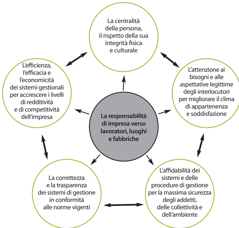
Figura 4 I valori di RadiciGroup