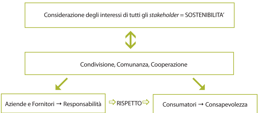
Figura 2 Il "patto sostenibile"

Ecco quindi che la visione "olistica" dell'imprenditorialità sostenibile suggerita da Freeman può assurgere a principio generale di un nuovo business model ideale per le imprese di moda, che necessita di un rapporto diverso tra tutti gli attori, un green agreement che così si può schematizzare: